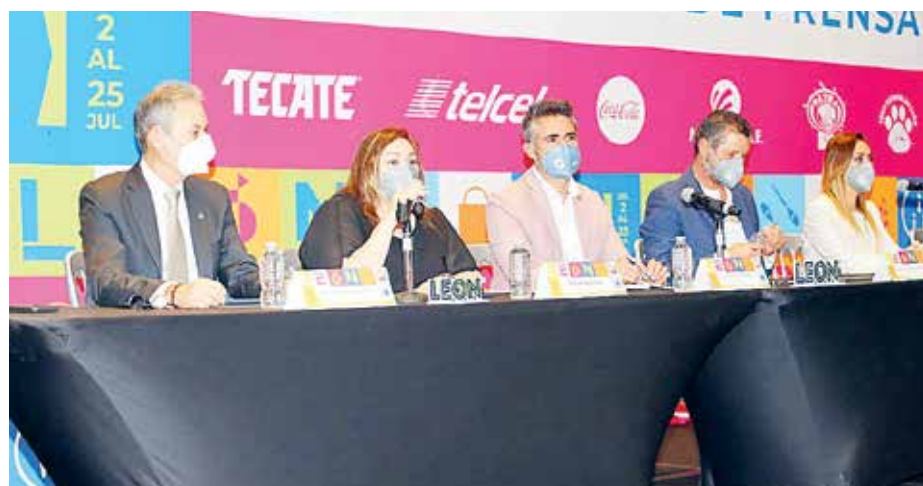
Habrán cantantes de talla internacional y espectáculos diversos. ESPECIAL

La lucha libre se efectuará en el Domo de la Feria con aforo controlado y actos circenses en espacios abiertos, un Pabellón de las Naciones con la presencia de más de 16 comunidades extranjeras, además de una exposición itinerante de 'Las momias viajeras de Guanajuato', zonas comerciales para impulsar a los grandes talentos locales por medio de 'Marca Gto'.