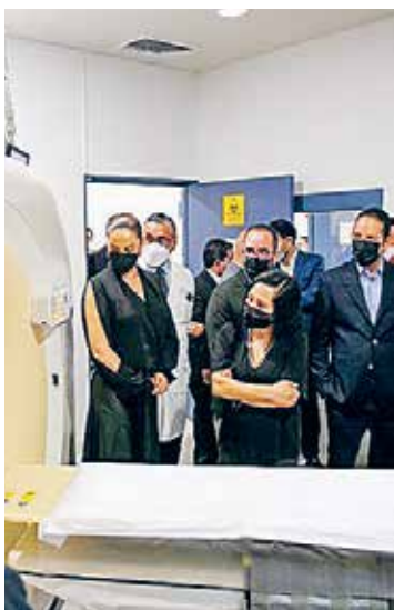
El nuevo nosocomio inició funciones.